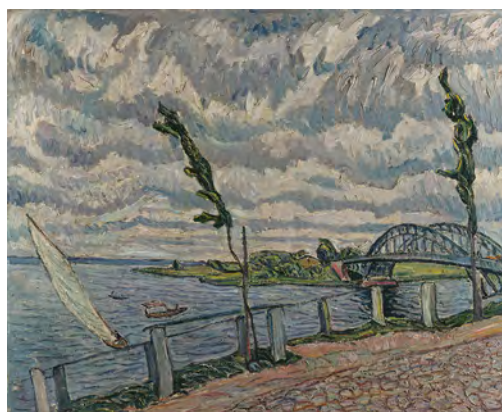
Theo von Brockhusen, Wind an der Havel, Gellnow, um 1914