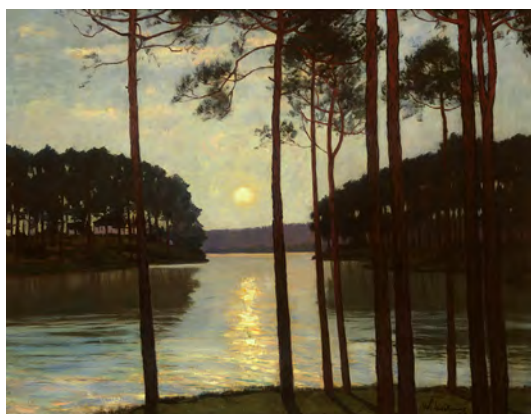
Walter Leistikow, Abendstimmung am Schlachtensee, um 1895