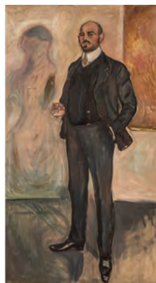
Edvard Munch, Porträt Walther Rathenau, 1907 © Sammlung Stiftung Stadtmuseum Berlin, Foto: Oliver Ziebe, Berlin