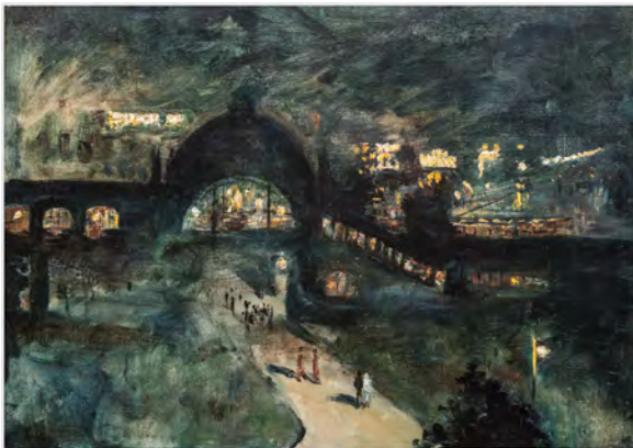
Lesser Ury, Bahnhof Nollendorfplatz bei Nacht, 1925