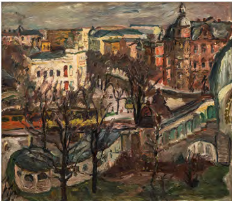
Max Beckmann, Nollendorfplatz, 1911