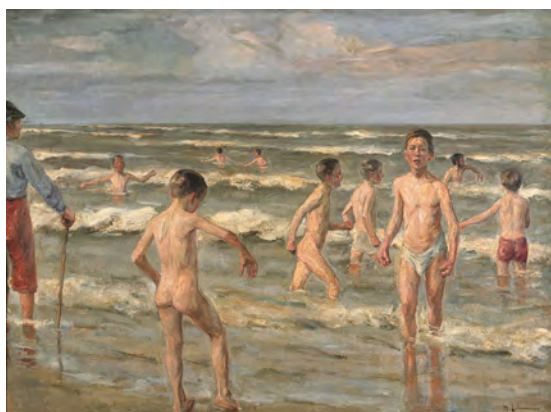
Max Liebermann, Badende Knaben, 1900