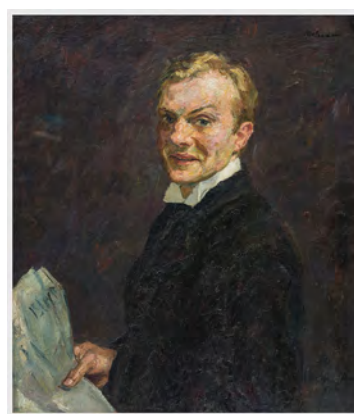
Max Beckmann, Selbstbildnis (lachend), 1910