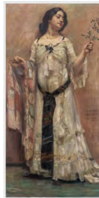
Lovis Corinth, Porträt Charlotte Berend im weißen Kleid, 1902