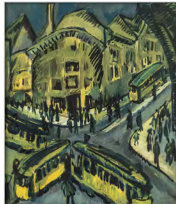
Ernst Ludwig Kirchner, Nollendorfplatz, 1912