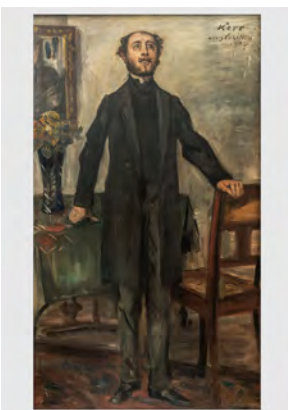
Lovis Corinth, Porträt Alfred Kerr, 1907