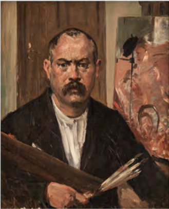
Lovis Corinth, Selbstbildnis, 1900