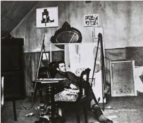
Ohne Titel (Iwan Puni in seinem Berliner Atelier), 1921, Berlinische Galerie