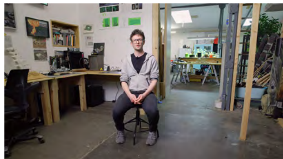
Andreas Greiner, Malzfabrik, Berlin-Tempelhof, Film Still, 2023, © Berlinische Galerie, alle gezeigten Werke von Andreas Greiner, © VG Bild-Kunst, Bonn 2023