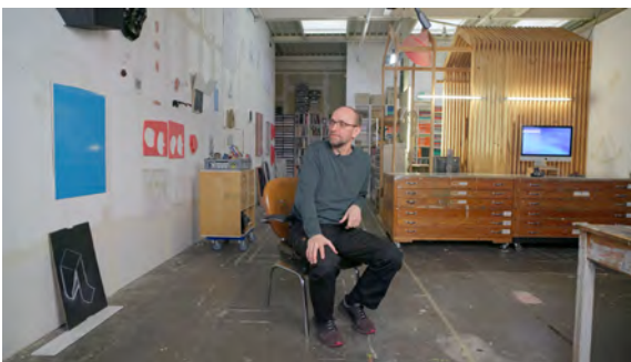
Heiner Franzen, Uferhallen, Berlin-Wedding, Film Still, 2023, © Berlinische Galerie, alle gezeigten Werke von Heiner Franzen, © Heiner Franzen