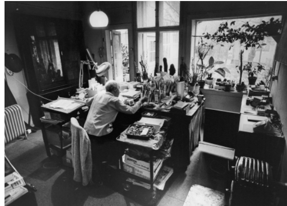
Ohne Titel (Hannah Höch in ihrem Haus in Berlin-Heiligensee), 1975, Berlinische Galerie