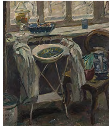
Max Beckmann, Stilleben mit Aussicht aus dem Atelier im Schnee, 1909, Ständige Leihgabe Privat-besitz, Haar, © Urheberrechte am Werk erloschen