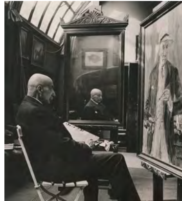
Fritz Eschen, Ohne Titel (Max Liebermann in seinem Atelier am Pariser Platz), um 1930, Berlinische Galerie