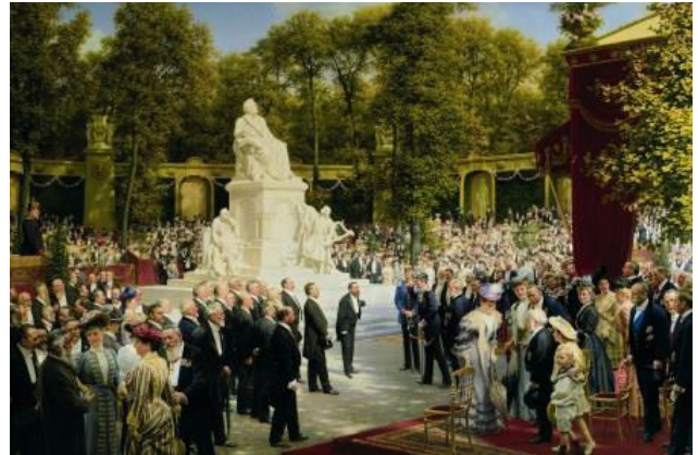
Anton von Werner, Enthüllung des Richard-Wagner-Denkmal im Tiergarten, 1908, Berlinische Galerie, Urheberrechte am Werk erloschen

In Kooperation mit Jugend im Museum e.V.